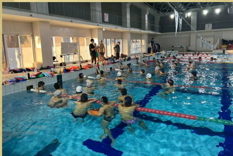
▲練習時にコーチの話を聞く様子