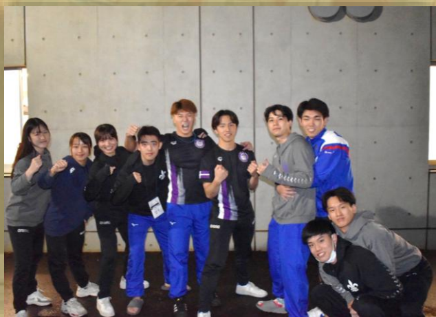
▲自己ベストを更新した部員達