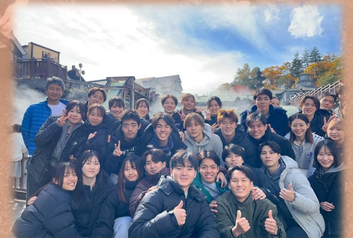
▲湯畑での集合写真