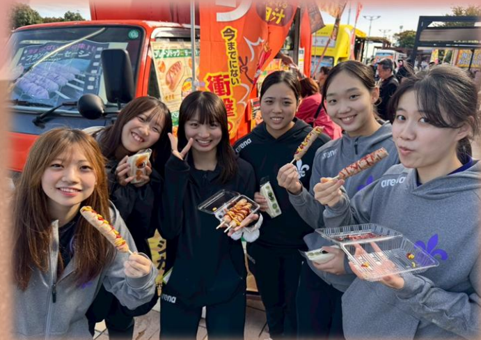
▲パーキングエリアで楽しむ部員達