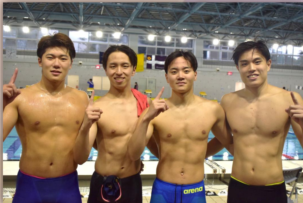
▲立教新記録を樹立した男子フリーリレーメンバー