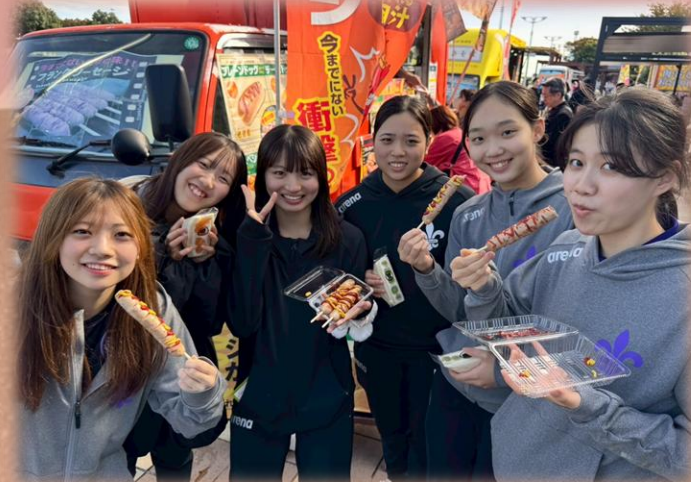
▲パーキングエリアで楽しむ部員達