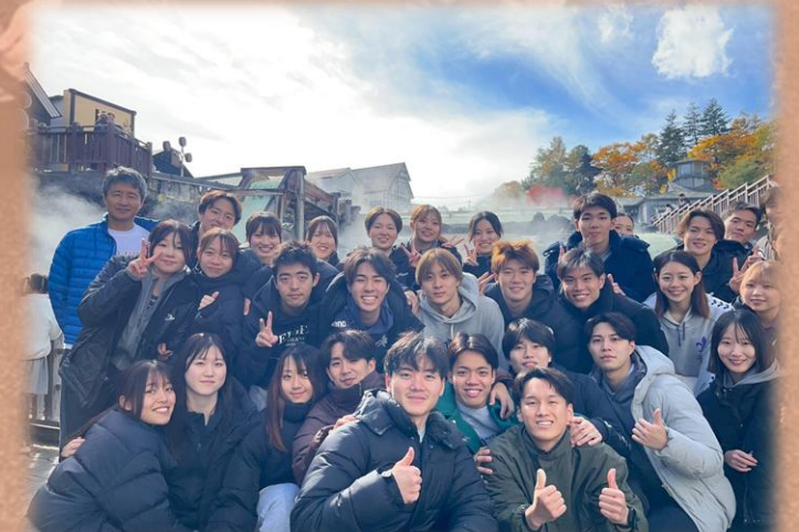
▲湯畑での集合写真