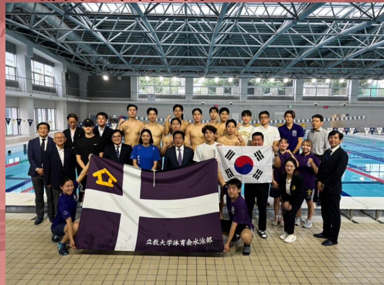
▲歓迎セレモニー後の集合写真