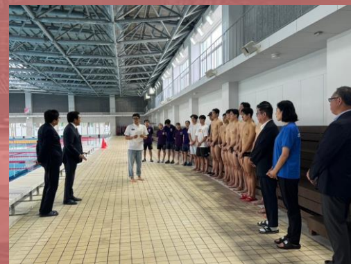
▲歓迎セレモニーの様子