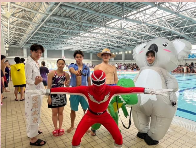
▲仮装で会場を盛り上げた部員たち