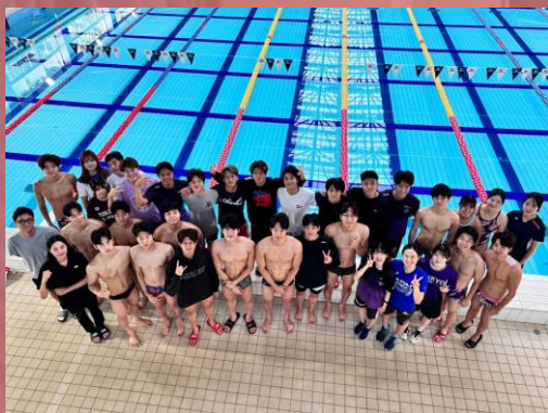
▲韓国代表と部員の集合写真