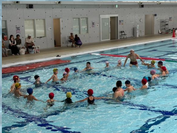
幼児クラスの様子