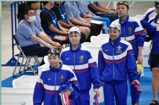
▲女子4×100mFRメンバー (4年高原・2年野井・1年柳下・4年上原)