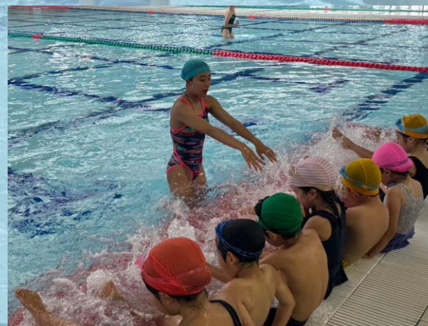
▲バタ足の練習の様子