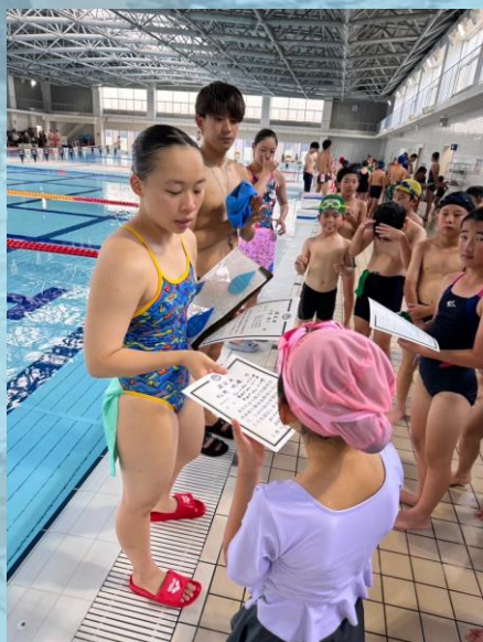
▲認定証授与の様子