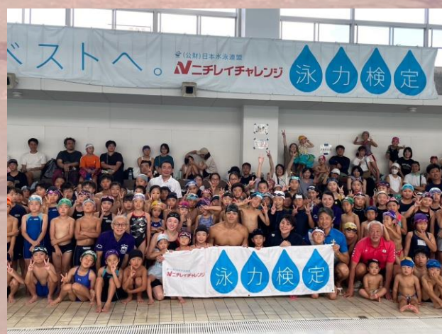
▲ゲストと子どもたちの集合写真