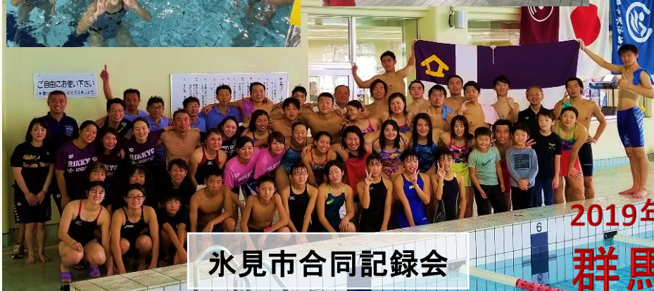
氷見市合同記録会